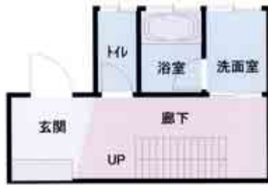
間取り図（リフォーム前）

リフォーム前 の間取り図はトイレと浴室+洗面室が別々の出入り口になっていきます。この空間をバリアフリーにして、さらに年齢を重ねても住みやすく使い易い『ひとつの場所』にしたかったことからリフォームをしました。特にトイレと洗面室は浴室を挟んでいて、生活のペースに合わず、不便を感じていました。