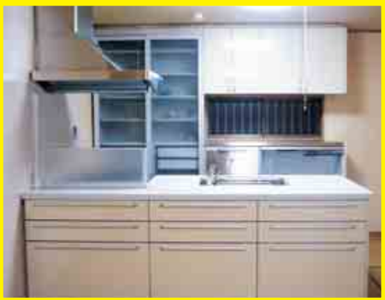
アイランドキッチン

西側にあったキッチンにアイランドキッチンを設置しようとしたところ、柱の関係で間口が広く取れず、以前、和室があった東側にキッチンを設置し、和室とダイニングを一つの部屋にして、全面に床暖房を敷設しフロアリングで仕上げました。以前キッチンがあった場所には書斎を設置しました。階段には壁面全体に本棚を設置しました。また、家の強度を補強するために、今回リフォームした場所の壁に筋交いを増設しました。