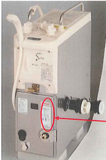
【給湯・シャワー付きタイプ】