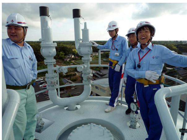
6000m 3 ガスホルダー登頂体験

今年は8月29日から3日間、2年生3名の生徒たちが体験学習に望みました。3名とも夏休みの最後の期間を活用して学習に望み、熱心に取り組んでいる姿にとっても好感が持てました。以下にその体験学習の取り組む姿をご紹介します。