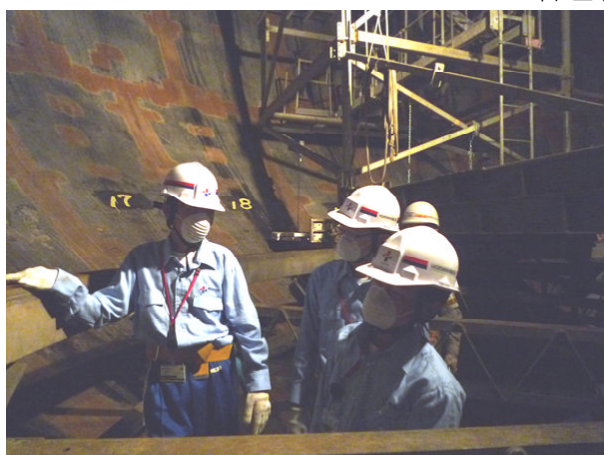
開放検査中のガスホルダー内部体験