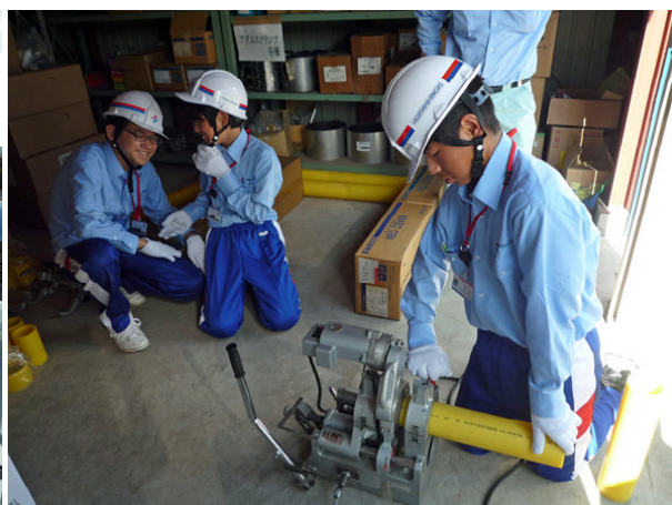
ポリエチレン管融着体験